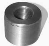
Tapones con Hueco - Diesel