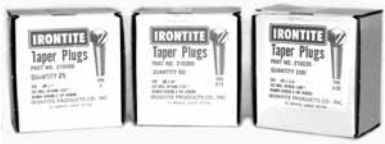
Tapones con Rosca, Hierro Ductile - Automotriz