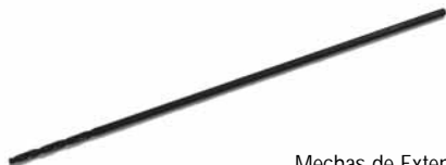
Mechas de Extencion